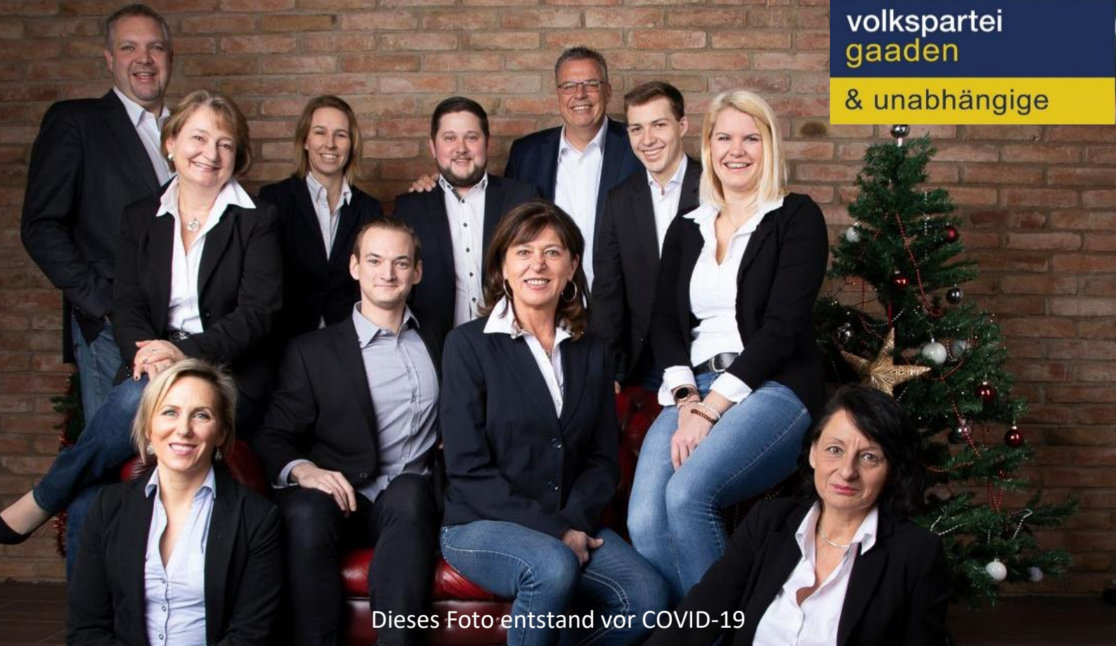
Dieses Foto entstand vor COVID-19